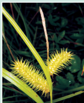
Le carex luisant

Espèces semblables : Le carex luisant ( Carex lurida ) a la même taille et des pointes (épés) de fleurs semblables. Il a des feuilles de 4 à 7 mm de large qui rallongent bien plus haut que le fait de la tige. La tige est violette à la base. Il y a seulement une pointe de fleur mâle et typiquement 1 à 4 (souvent 2 ou 3) pointes de fleurs femelles.